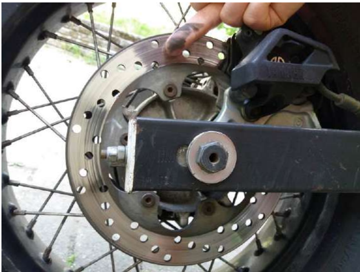
Kuva 2. Harmaan kalvon peittämä liukaspintainen takajarrulevy 29.6.2021.