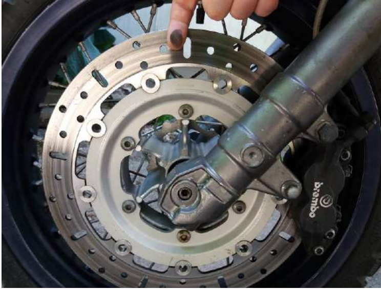
Kuva 1. Harmaan kalvon peittämä liukaspintainen etujarrulevy 29.6.2021.