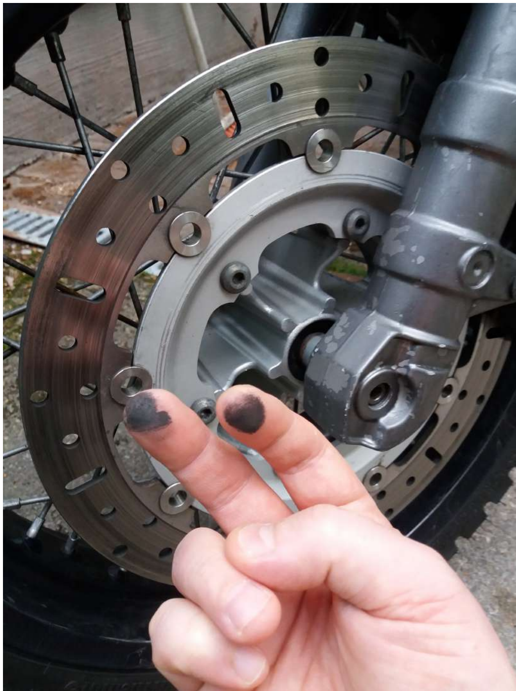
Kuva 1. Harmaan kalvon peittämä liukaspintainen etujarrulevy 11.8.2021.