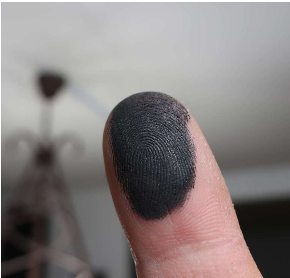
Kuva 3. Jarrulevystä irtoava tummanharmaa aine 12.10.2021.