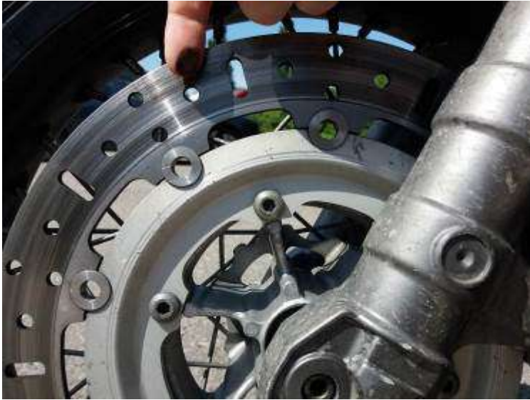
Kuva 1. Mustan öljykalvon peittämä liukaspintainen etujarrulevy 7.6.2021.