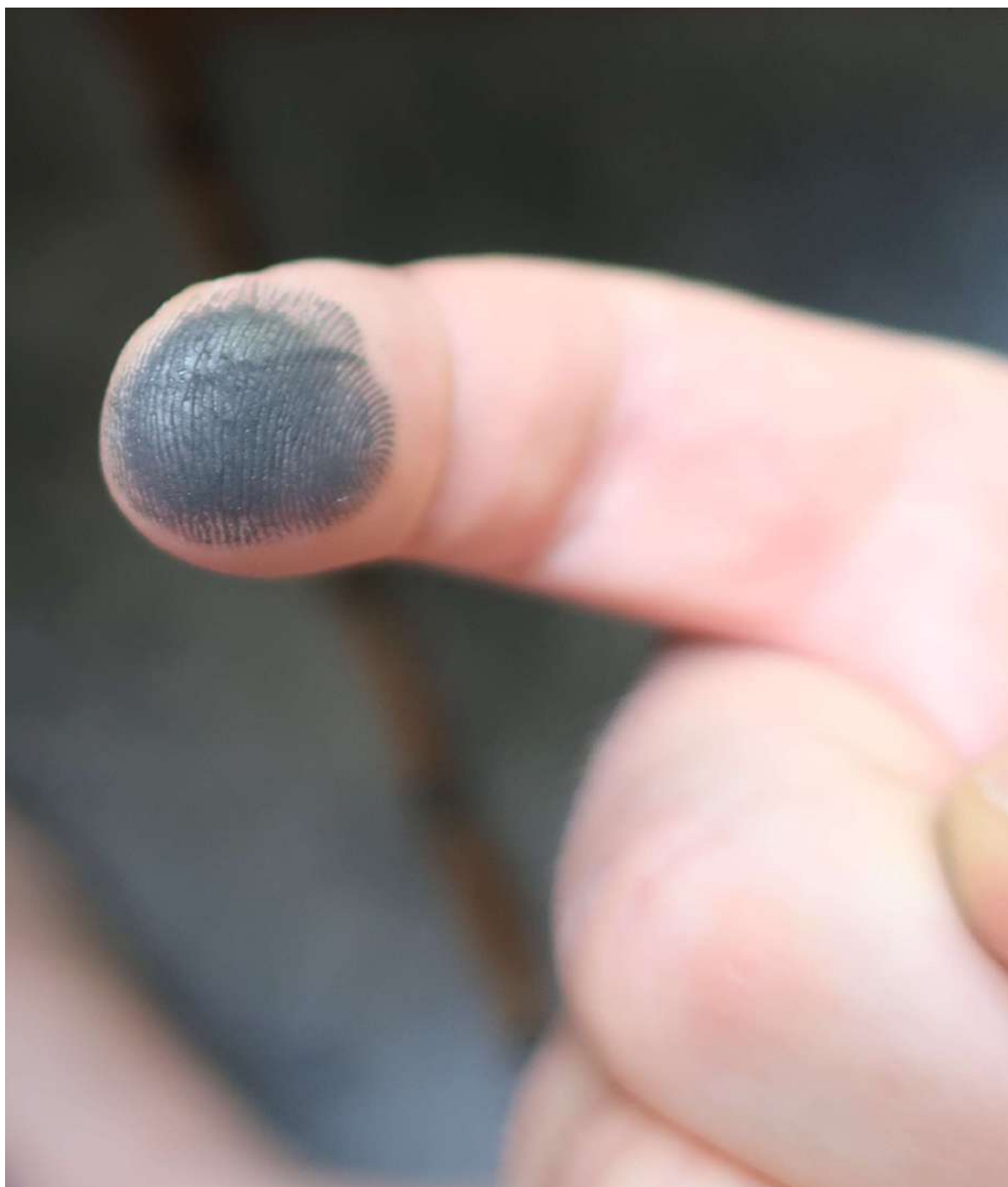
Kuva 2. Etujarrulevystä irtoavaa harmaata liukasta ainetta 13.8.2021.