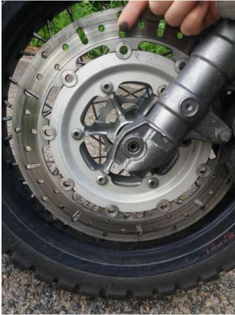
Kuva 1. Harmaan kalvon peittämä liukaspintainen etujarrulevy 23.6.2021.