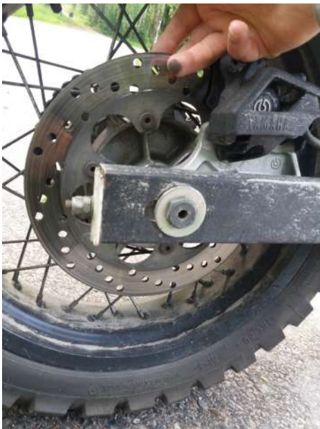
Kuva 2. Harmaan kalvon peittämä liukaspintainen takajarrulevy 23.6.2021.