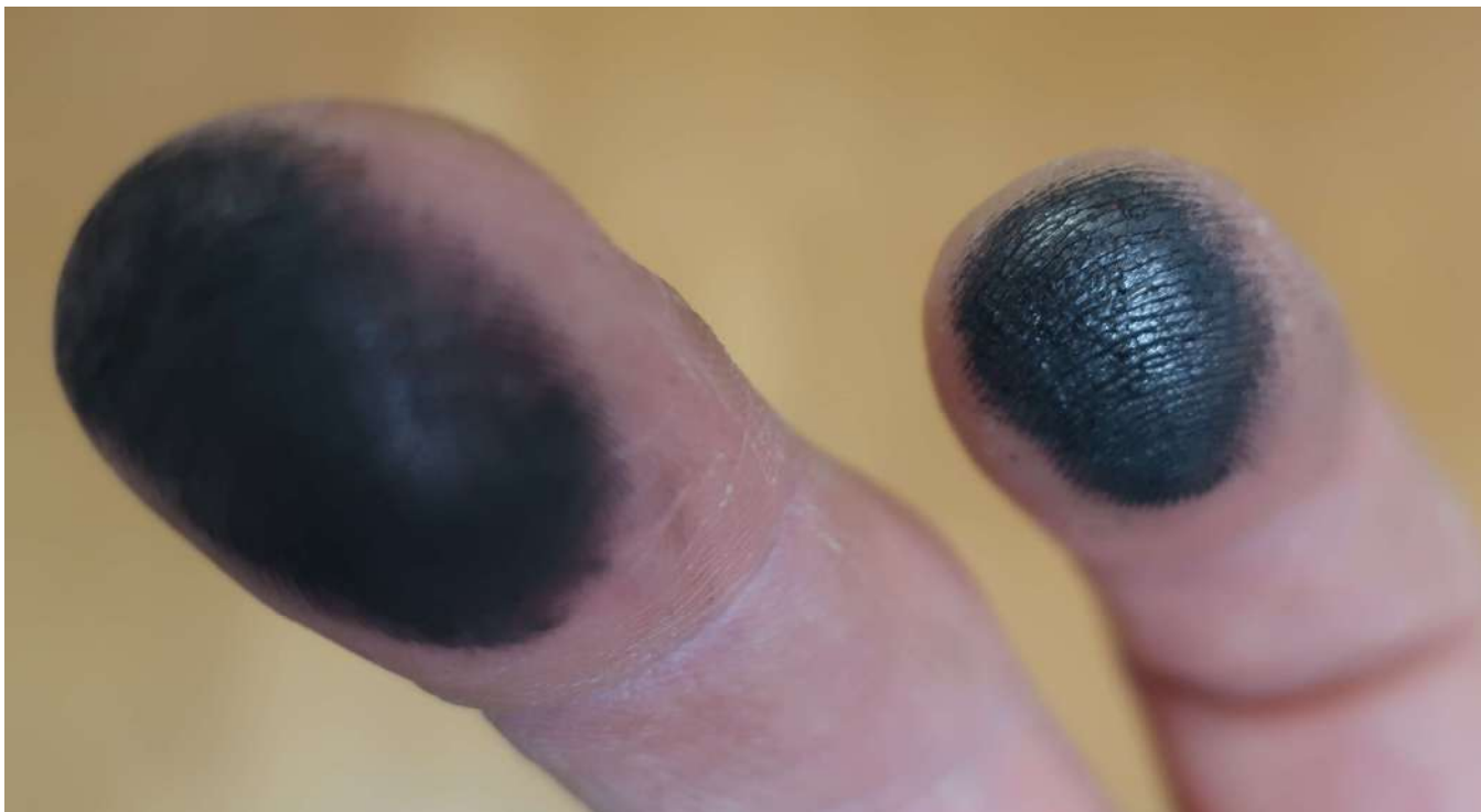
Kuva 4. Jarrulevystä irtoava tummanharmaa liukas aine. Vasen sormi takajarrulevy. Oikea sormi etujarrulevy. 16.10.2021.