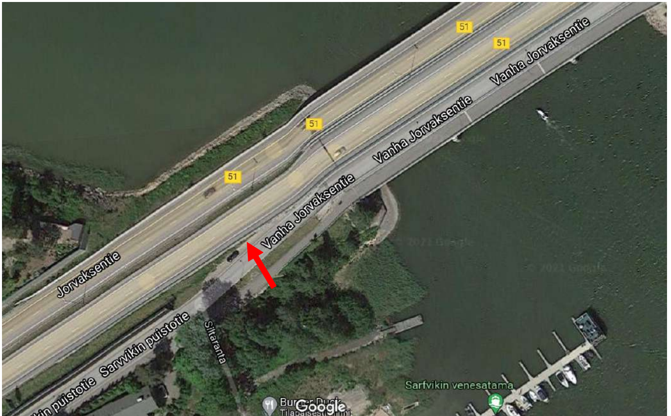
Kuva 1. Moottoripyörän pysäköintipaikka.