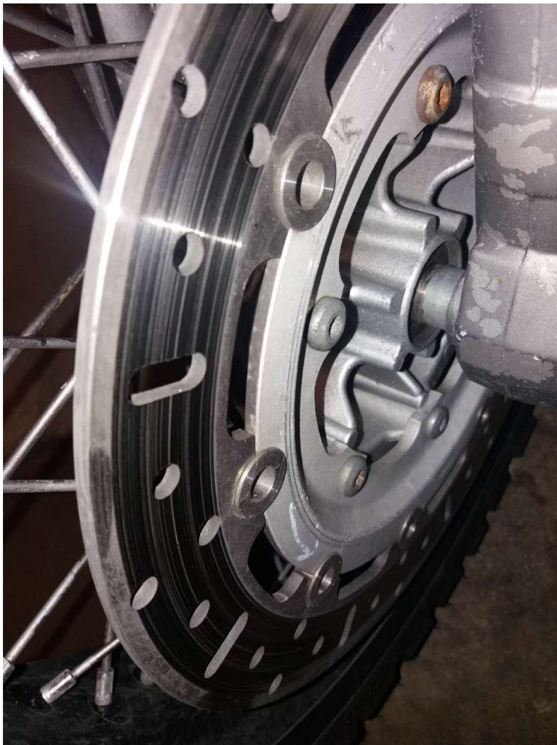
Kuva 2. Tummanharmaan kalvon peittämä etujarrulevy 16.10.2021.