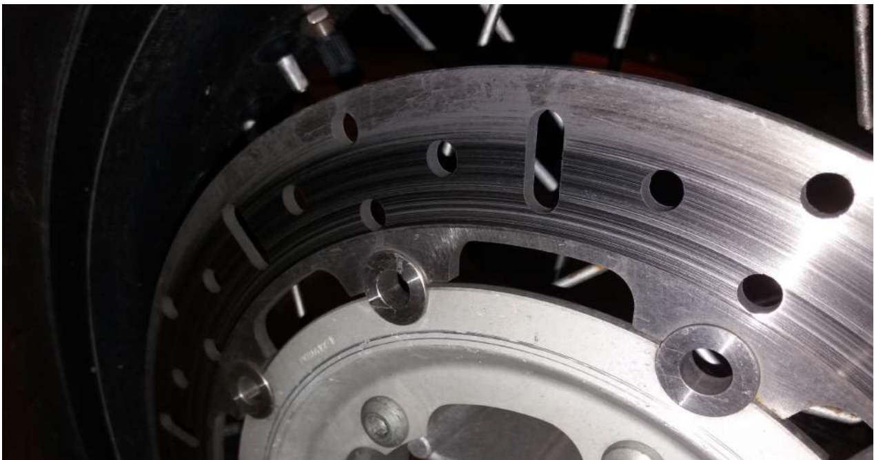
Kuva 2. Harmaan kalvon peittämä liukaspintainen etujarrulevy 12.10.2021.