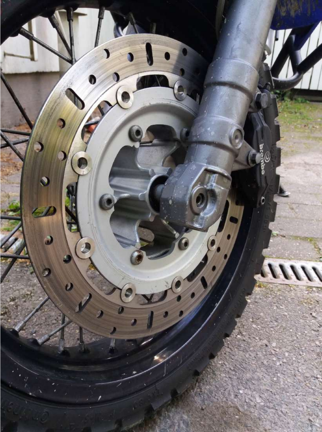
Kuva 1. Harmaan kalvon peittämä liukaspintainen etujarrulevy 9.9.2021.