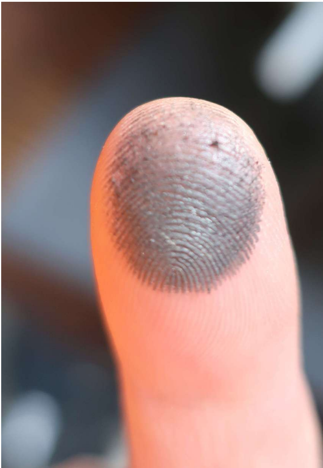
Kuva 2. Etujarrulevystä irtoavaa harmaata liukasta ainetta 9.9.2021.