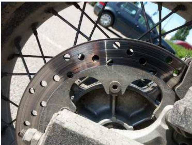
Kuva 2. Mustan öljykalvon peittämä liukaspintainen takajarrulevy 7.6.2021.