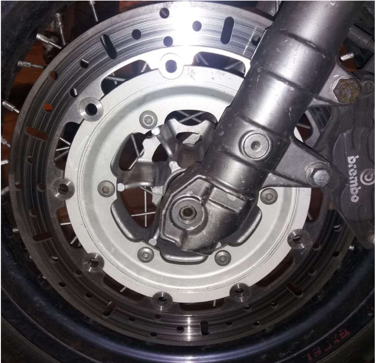
Kuva 3. Harmaan kalvon peittämä liukaspintainen etujarrulevy 16.10.2021.