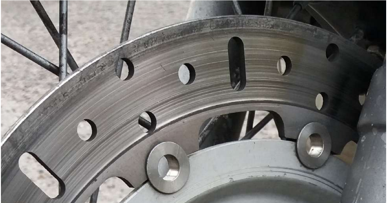
Kuva 1. Tummanharmaan kalvon peittämä etujarrulevy 11.10.2021.